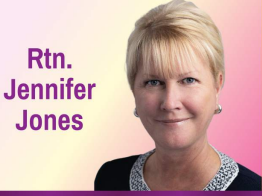
Rtn. Jennifer Jones